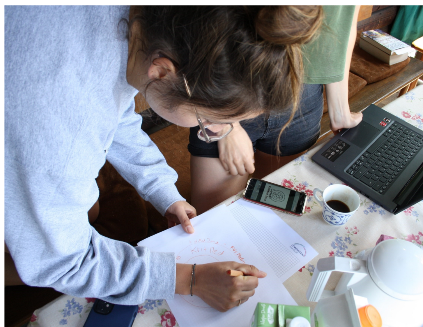
Klausurtagung Helensteinhütte - Rot- henstein