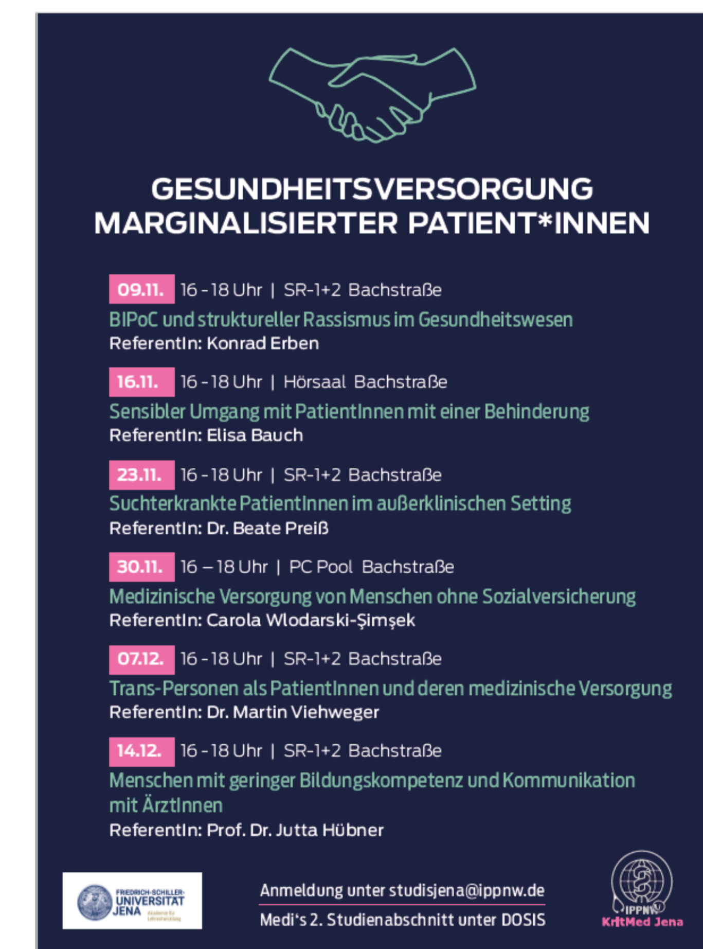
Poster Werbeposter mit allen Veranstaltungen

Entworfen wurde das Poster von Gabriele Geißler. Die Designerin hatte zuvor schon mit uns zusammengearbeitet.