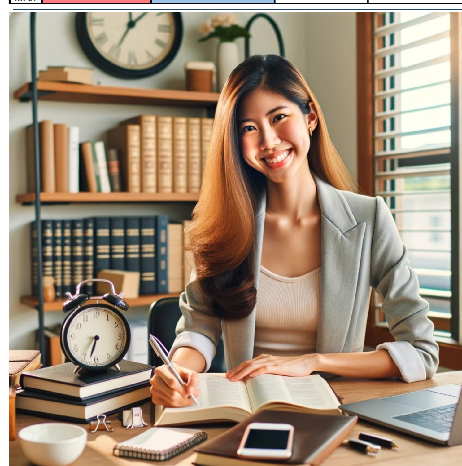
Bild 6 Das Bild zeigt eine lächelnde Studentin, die an einem aufgeräumten Schreibtisch sitzt und Notizen macht, umgeben von ordentlich gestapelten Büchern und einem Smartphone mit geöffneter Kalender-App.