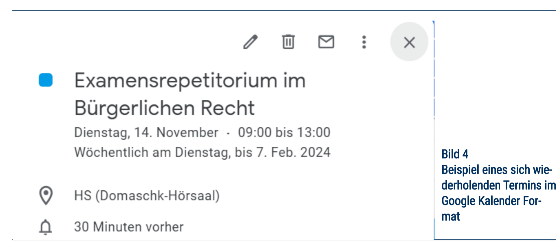
Bild 4 Beispiel eines sich wiederholenden Termins im Google Kalender Format