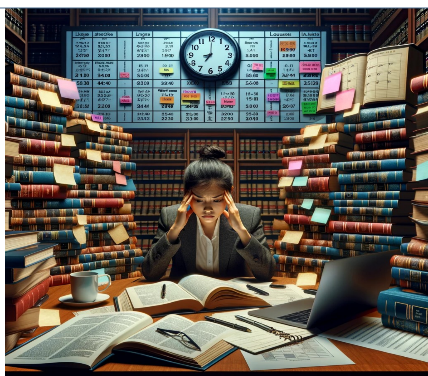
Bild 1 Das Bild zeigt eine gestresste Jura-Studentin umgeben von Büchern und einem komplexen Lernplan bei Nacht.

Die Vorbereitung auf das erste Staatsexamen in Jura ist komplex: Viel Stoff, straffes Zeitmanagement und der Druck, erfolgreich zu sein, führen zu einer enormen Belastung für die Studierenden.