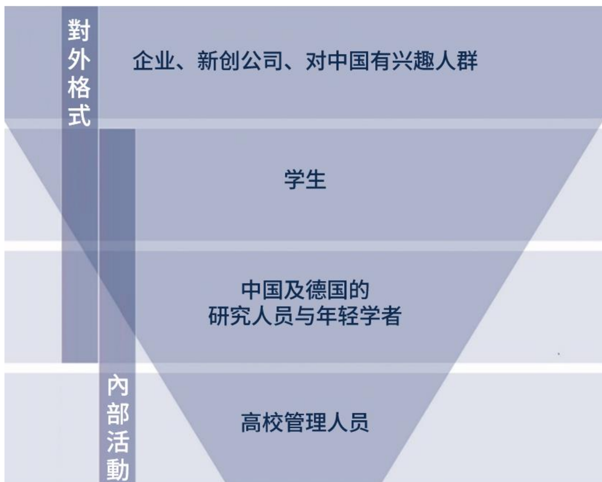
图表一：计划措施的广泛影响

此计划的目标群体包含管理人员、研究人员与年轻学者、学生、教师及所有对创立学术机构有兴趣的人们。