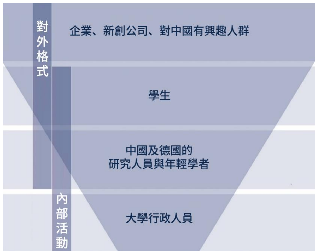
圖表一：計畫措施的廣泛影響

此計畫的目標群體包含行政人員、研究人員與年輕學者、學生、教師及所有對創立學術機構有興趣的人們。