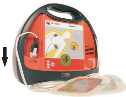
3. Defibrillator öffnen