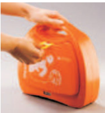
2. Defibrillator entnehmen

- Herzdruckmassage und Beatmung im Verhältnis 30:2