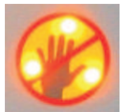
7. Patienten nicht berühren, Datenauswertung läuft!