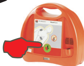
6. Falls das Gerät einen Schock anweist, drücken Sie die blinkende Schocktaste!