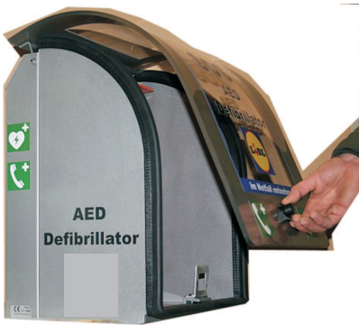
1. Deckel öffnen